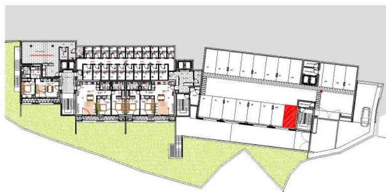
Localização do Lugar de Estacionamento : Piso -1