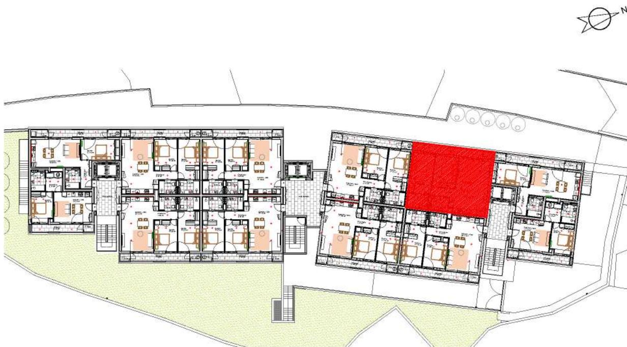
Localização da Fração : Piso 4