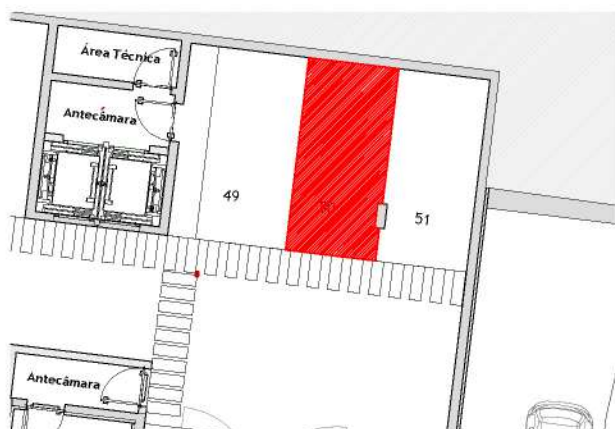
Lugar de Estacionamento : Piso -1