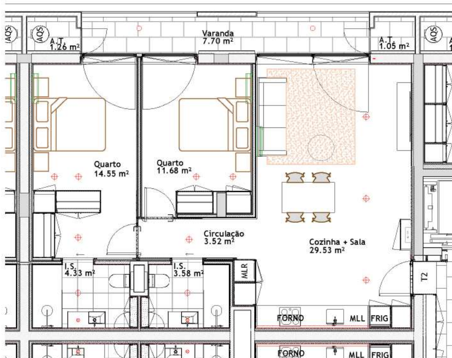
Planta da Fração

Localização : --- Identificação : --- Área do Arrumo : ---