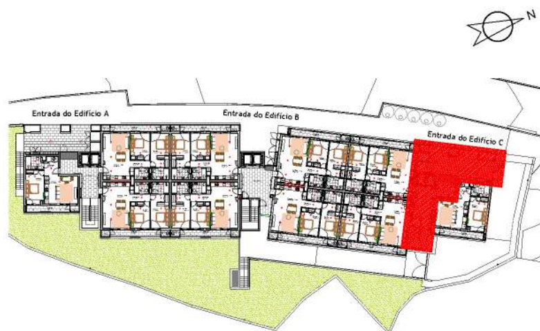
Localização da Entrada do Edifício : Piso 1