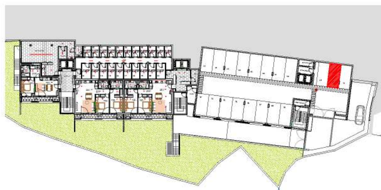
Localização do Lugar de Estacionamento : Piso -1