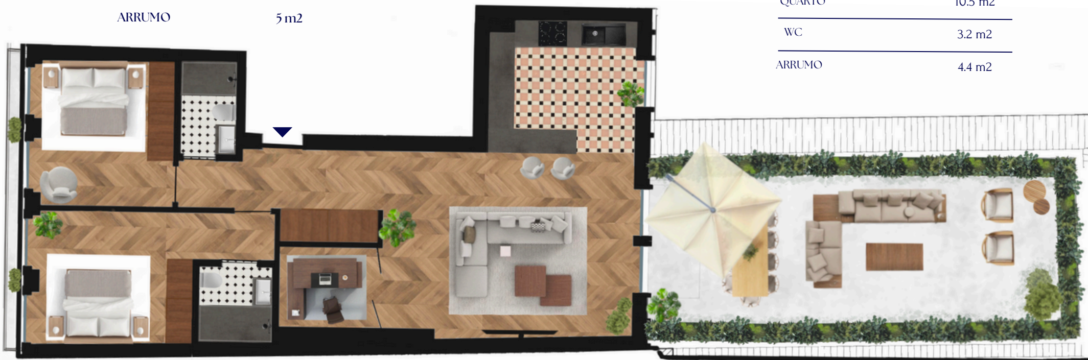
PLANTA DA FRAÇÃO